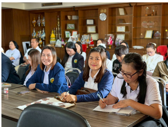
ภาพกิจกรรมผู้เข้าร่วมอบรมโครงการอบรมส่งเสริมคุณธรรมและจริยธรรม บุคลากรเพื่อความโปร่งใสตามหลักธรรมาภิบาล ประจำปี ๒๕๖๙